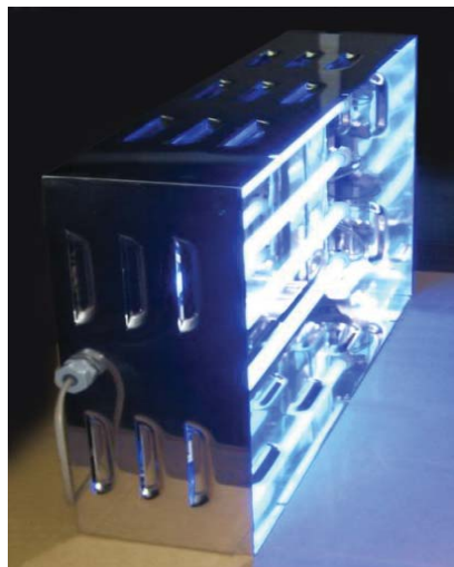
ブルーレイ照射装置